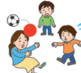
友人同士で遊んでいる最中に、あやまって通行人にケガをさせてしまった!