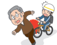
自転車を運転中、あやまって他人と接触してケガをさせてしまった!