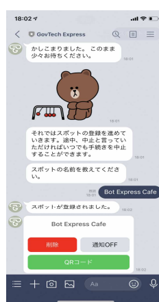
③店舗名称等の質問に回答していくとQRコードを掲載した様式が発行されます。