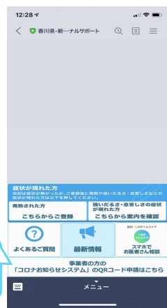
②トーク画面下部の『事業者の方のコロナお知らせシステムのQRコード申請はこちらから』をタップ。