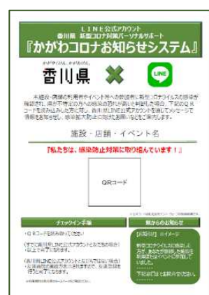
④印刷して店舗等に掲示してください。