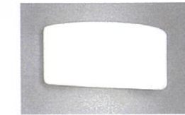
照明 OB071189LR ※オーデリック製