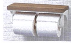
棚付2連紙巻器 (木質タイプ) CF-AA64KU