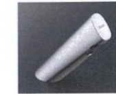
自動単水栓 (100V・排水栓なし) /オートマージュA AM-300CV1