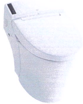
パブリック向け タンクレストイレ (床排水・K213G ・発電壁リモコン ・洗浄タッチスイッチ付) BC-K21S・DV-K213GL-R1