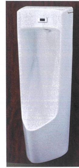
センサー一体形小便器 (壁掛・塩ビ管・100V ・クリーントラップ) U-A51AP