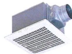
換気扇 VD-15ZY14 ※三菱製