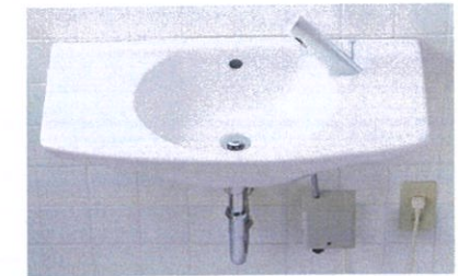
カウンター一体形洗面器 L-275AN