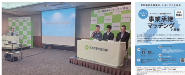
令和6年11月に高知県で開催した事業承継マッチングイベントの様子と同イベントのチラシ

第三者承継という自分には難しいのでは、という印象を持たれる方も多いと思いますが、後継者の確保に悩まれている方は、商工会や日本公庫に一度ご相談いただければと思います。大切な事業を次の世代に残せるよう、精一杯お手伝いしたいと考えています。